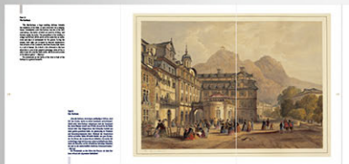
Bildseite mit Ausklapper