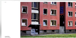
Büchertitel und Innenseiten